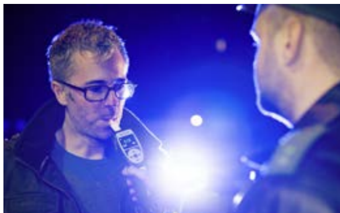
Haben Sie etwas getrunken? Aus Sicht der Polizei gibt es zu wenig Kontrollen

Wundermittel, die beim Ausnüchtern helfen, gibt es übrigens nicht. Weder der Espresso nach dem Grappa noch eine kalte Dusche nach der Party, weder das Glas Tomatensaft noch das Ausschwitzen beim Joggen senken den Pegel. Von Promillerechnern im Internet, Faust- →