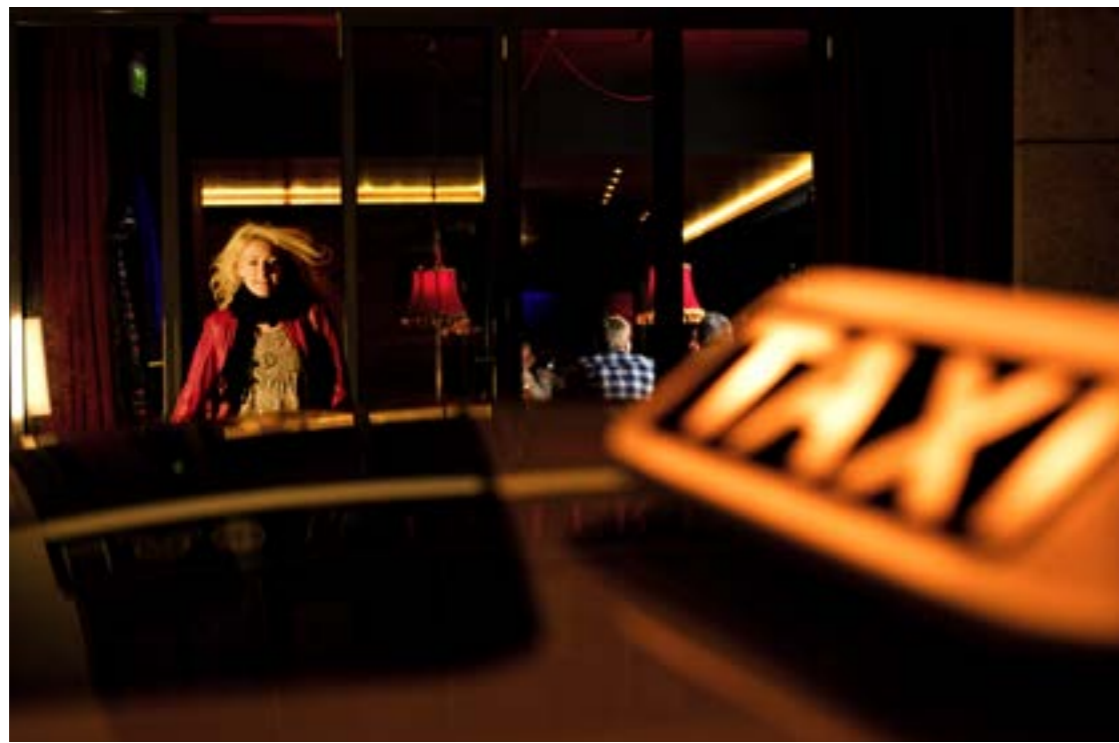
Der sichere Heimweg: Im Zweifel ist das Taxi immer die bessere Wahl

zistisch-psychologische Untersuchung (MPU) verlangen muss. Entscheidend sind Vorgeschichte und Umstände der Alkoholfahrt: Passierte es morgens um 10 Uhr oder spätabends, wurde ein Erst- oder Wiederholungstäter erwischt.