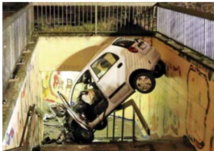
Mit 2,5 Promille in die Fußgängerunterführung: Kontrollverlust in Bad Staffelstein

Aber müssen Autofahrer überhaupt damit rechnen, erwischt zu werden? Der Bundesvorsitzende der deutschen Polizeigewerkschaft Rainer Wendt verneint. „In den letzten Jahren wurden viele Stellen abgebaut“, sagt er. „Wir können kaum noch ordentlich kontrollieren.“ Mehr